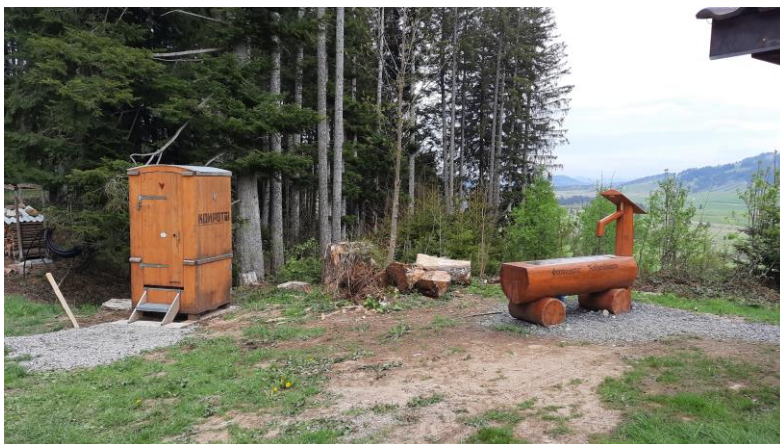
Kompotoi bei der Feuerstelle Gärtenboden

Feuerstellen sind sehr beliebt und werden gerne genutzt. Sollte das zurzeit eher miese Wetter wieder besser werden, kommt wieder die Gelegenheit es sich an einer der öffentlichen Feuerstellen gemütlich zu machen. In der Regel werden sich nach der Benützung auch wieder anständig zurückgelassen, indem der Abfall mitgenommen wird. Bei längerem Aufenthalt ist es aber natürlich, dass sich menschliche Bedürfnisse melden und diese wurden bisher nicht immer zur Zufriedenheit von Landbesitzern und Nachutzern erledigt. Nun wurden mobile WCs, in der Form von "Kompotoi" aufgestellt. Es ist nun zu hoffen, dass ihre Anstrengungen belohnt werden und damit die Ordnung an und rund um die Feuerstellen besser wird.