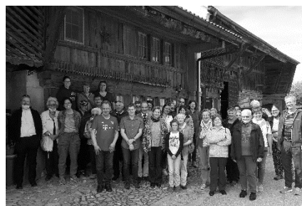
Pfarreiwallfahrt am 8. Mai nach Sviriez zur Marguerite Bays. Auf dem Bild: Die Gruppe vor dem Wohnhaus der Heiligen.

Die Andacht beginnt am Freitag, 18. Juni. Wir beten das Novengebete jeweils als Fürbitte in der Messe oder im Anschluss an die Messe.