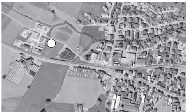
Abb. 2: Luftbild Standort Heizzentrale

kommen. Für die Heizzentrale wird nur eine Teilfläche der Parzelle KTN 124 benötigt. Die OAK Energie AG wird nur die für den Bau notwendige Fläche erwerben.